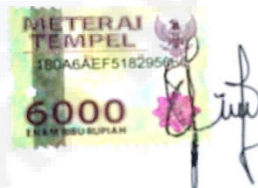
Intan Puspita Dewi