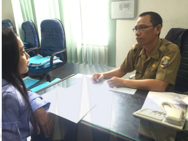
Foto wawancara pada narasumber