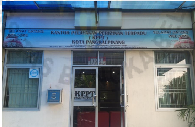
Foto halaman depan Kantor Pelayanan Perizinan Terpadu