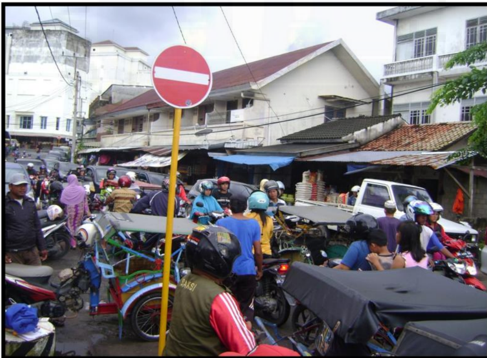
Foto Volume Kendaraan Pada Hari Libur