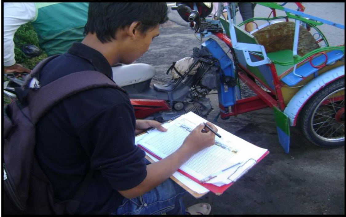
Foto Menghitung Volume Lalulintas