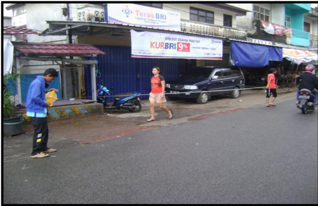
Foto Survei Kecepatan