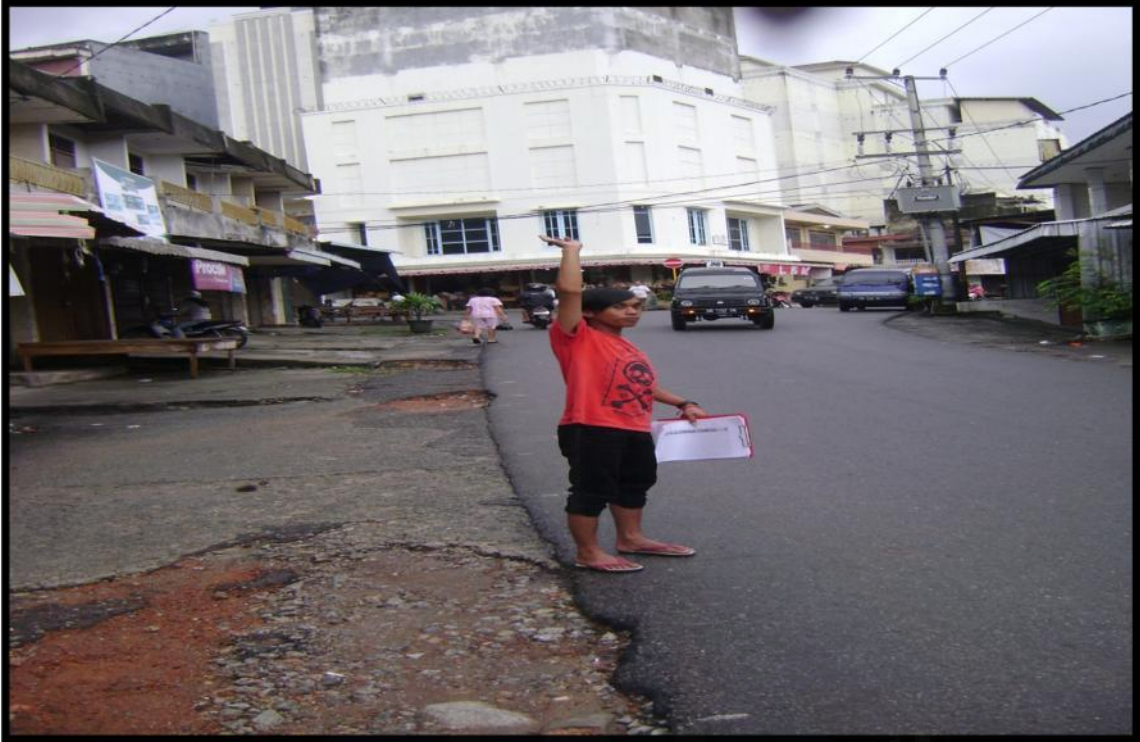
Foto Survei Kecepatan