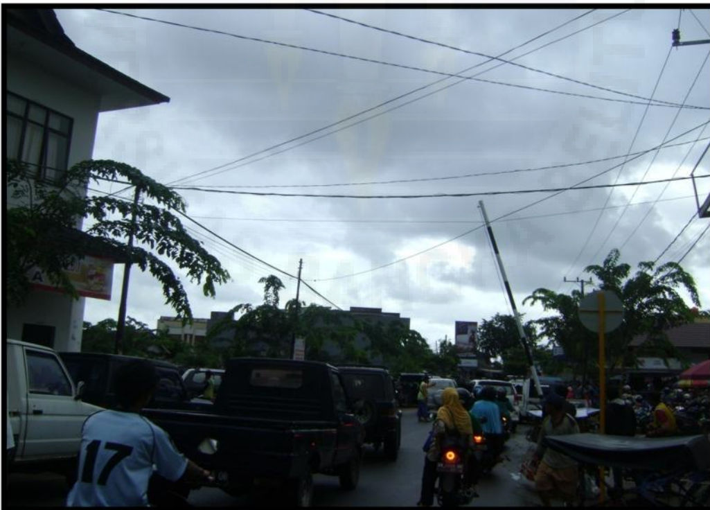
Foto Kendaraan Parkir