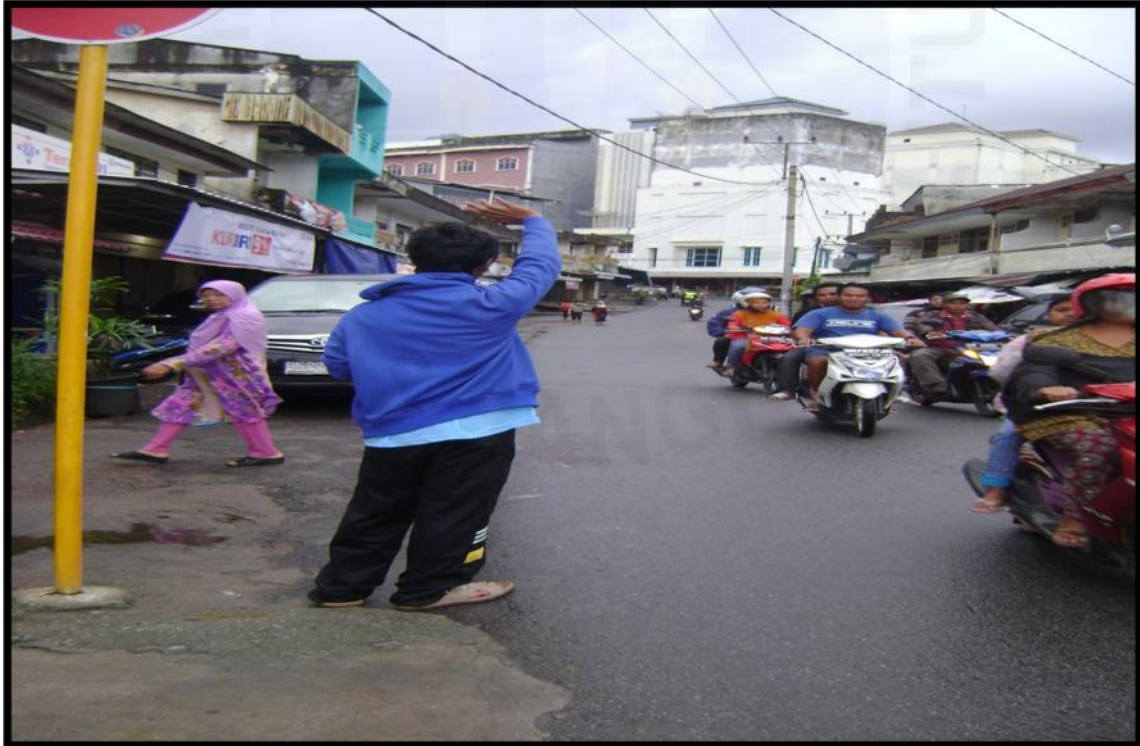
Foto Survei Kecepatan