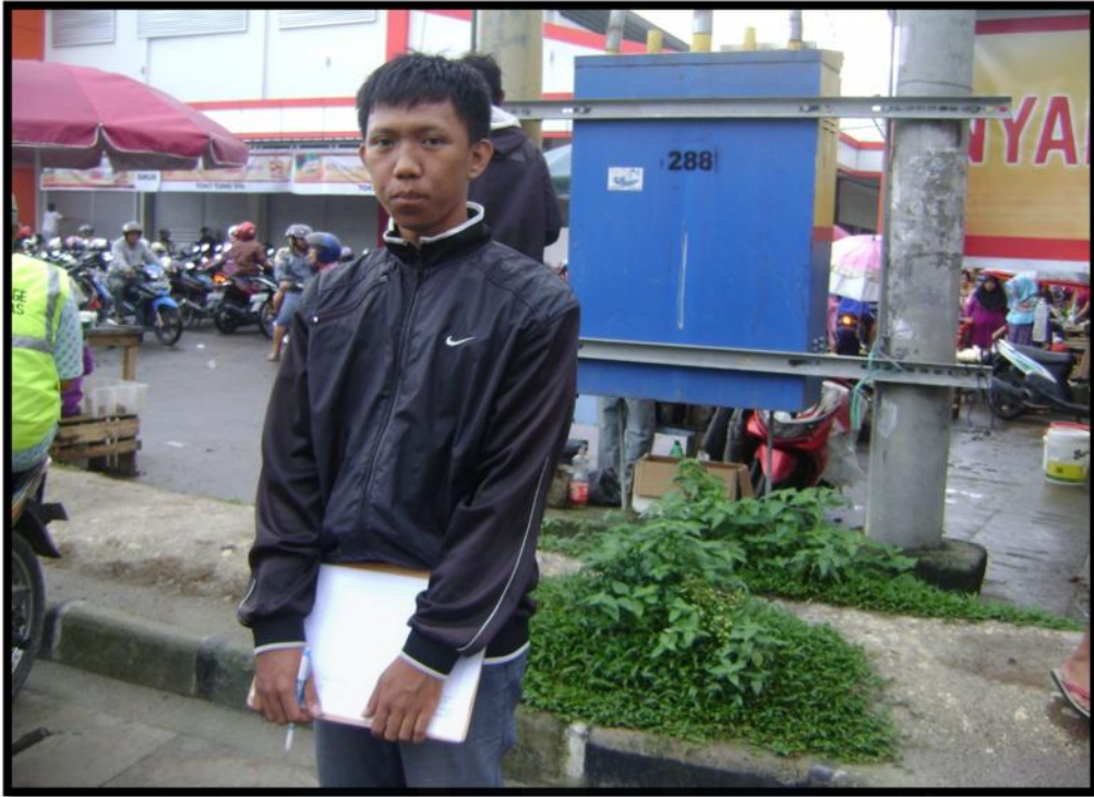
Survei Hambatan Samping