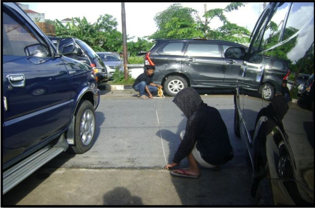
Foto Pengambilan Data Geometrik Jalan