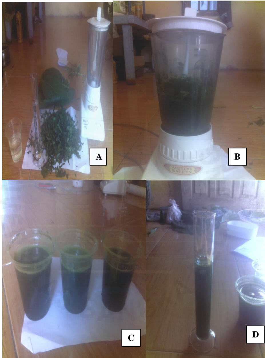
Lampiran 4. Pembuatan ekstrak daun mengkudu ( Morinda citrifolia L) (A), Pembelenderan daun mengkudu (B), Ekstrak daun mengkudu (C), Konsentrasi ekstrak daun mengkudu (D)