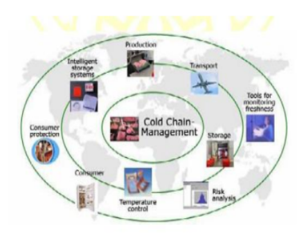
Gambar 2 Cold chain management (Lallossa, 2009)

Logistik rantai dingin sendiri merupakan gabungan antara kegiatan logistik dan pengendalian suhu. Dalam logistik rantai dingin tersebut, cold storage sebagai alat pembeku dan tempat penyimpanan ikan sangat penting. Cold storage ini harus dirancang dan digunakan secara tepat agar bisa berfungsi secara optimal. Menurut Lubis et al. (2010), sistem rantai dingin (cold chain system) adalah penerapan teknik pendinginan (0-4°C) terhadap hasil tangkapan secara terus menerus dan tidak terputus sejak penangkapan, penanganan, pengolahan, sampai distribusi produk ikan beku yang berlangsung sesuai standar. Cold chain management (Lallossa, 2009) sebagaimana tersaji pada Gambar 2 berikut.