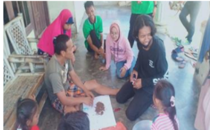
Gambar 3. Diskusi permasalahan dan kondisi yang ada di lokasi

mendatangi langsung, menggunakan media leflet yang disebarakan pada masyarakat yang berada di kawasan Dusun Limbung (Gambar 3).