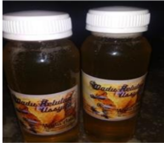
Gambar 4. Bentuk produk yang dihasilkan dengan desain kemasan baru

saing dan permasalahan pemasaran produk madu kelulut (Tabel 2).