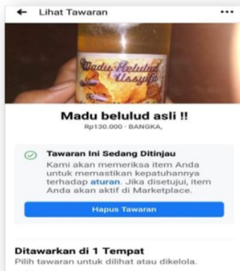
Gambar 6. Tampilan promosi online yang dibuat

untuk menawarkan produk. Semakin banyak pelaku usaha khususnya UKM melakukan konten yang berisi mengenai produknya semakin besar peluang orang lain mengetahui apa yang anda tawarkan. Jika mereka menyukainya, ini akan menjadi konten viral dimana akan banyak orang yang membicarakan mengenai produk yang ditawarkan. Dengan kemajuan teknologi atau pemasaran secara online pelaku usaha dalam mempromosikan dan memasarkan hasil produknya tidak harus bertemu langsung dengan konsumen ataupun bertatap muka, sehingga dalam hal ini dapat menghemat waktu dan biaya. Sejalan dengan berkembangnya internet, muncul pemahaman baru mengenai paradigma pemasaran berupa konsep pemasaran modern yang berorientasi pada pasar atau konsumen atau revolusi pemasaran berupa electronic marketplace (Kurniawati et al. 2019).