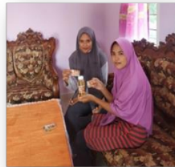
Gambar 5. Pelabelan produk madu kelulut

Kegiatan pembuatan Label atau Stiker untuk Kemasan Madu kelulut dilakukan bertujuan untuk lebih mengenalkan atau mempromosikan madu kelulut dari Dusun Limbung. Pembuatan label juga dilakukan agar madu dari dusun limbung lebih dikenal di pasaran. Kegiatan pembuatan stiker untuk Kemasan Madu kelulut dilakukan mulai pada tanggal 10 Agustus 2020 yang diawali dengan pemberian nama serta nomor telephone oleh pemilik madu kelulut, kemudian dilakukan kegiatan desain label atau stiker kemasan, setelah dilakukan disain serta penyesuaian dan persetujuan dari pemilik madu kelulut lalu stiker di cetak pada tanggal 18 Agustus 2020 (Gambar 5).