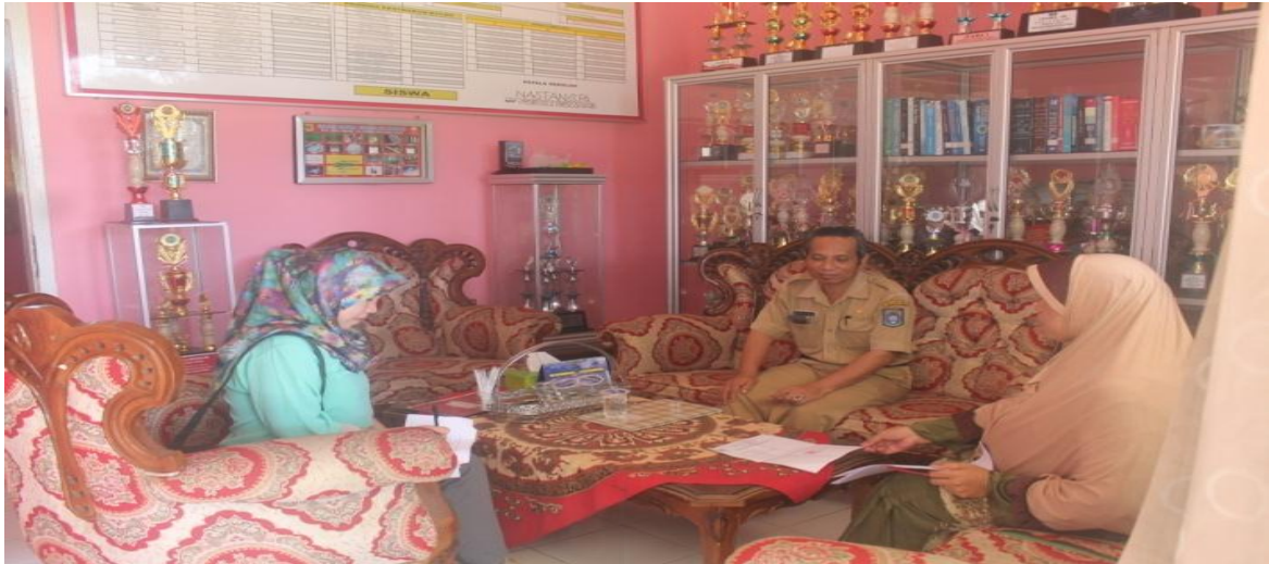
Gambar 3. Foto peneliti saat melakukan wawancara dengan kepala sekolah