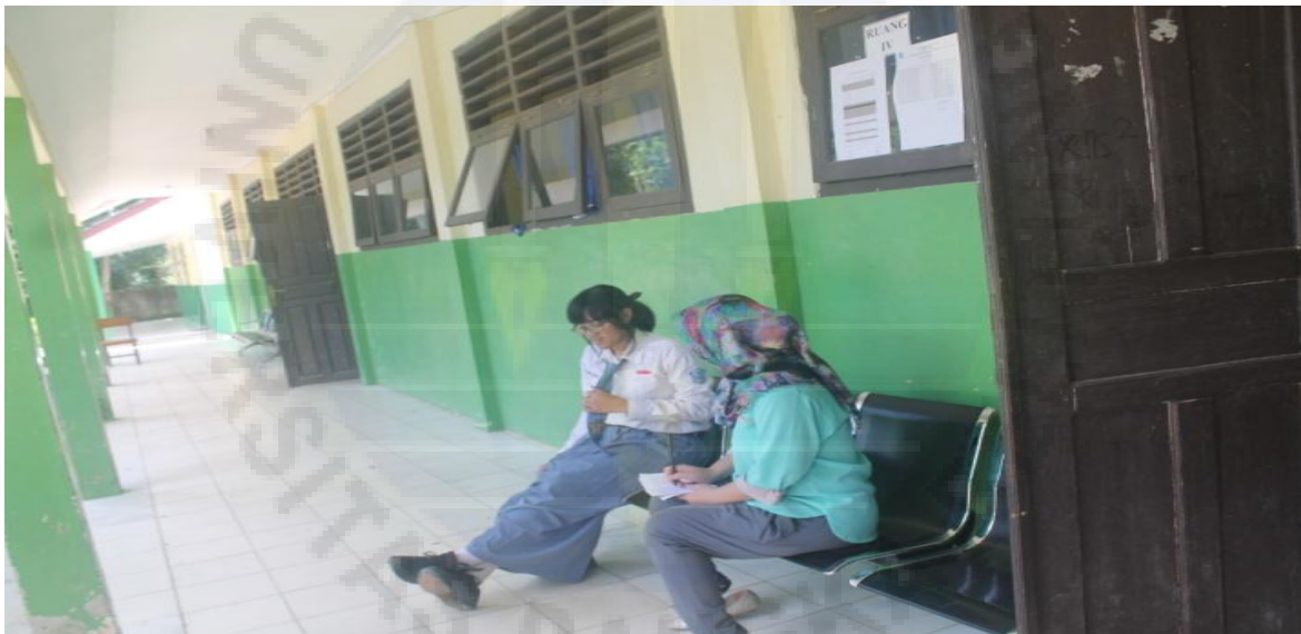
Gambar 4. Foto peneliti saat melakukan wawancara dengan siswi di sekolah