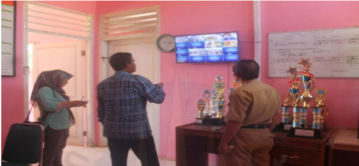
Gambar 1. Foto peneliti di ruang kontrol pengawasan kepala sekolah