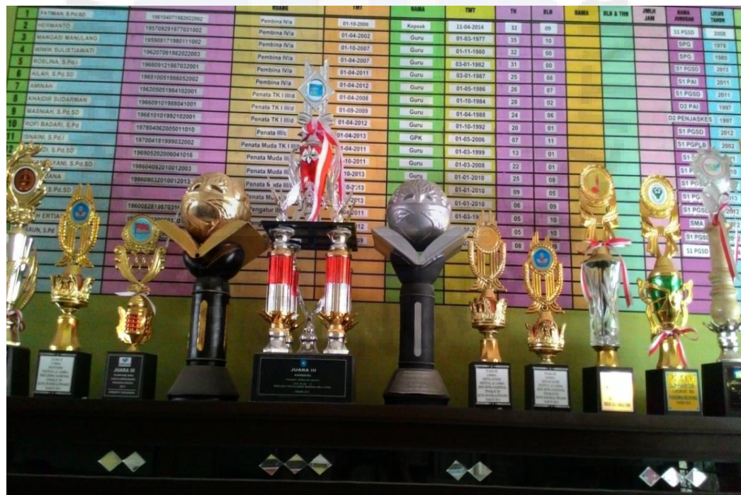
Gambar 4. Kumpulan piala yang diperoleh SD N 33