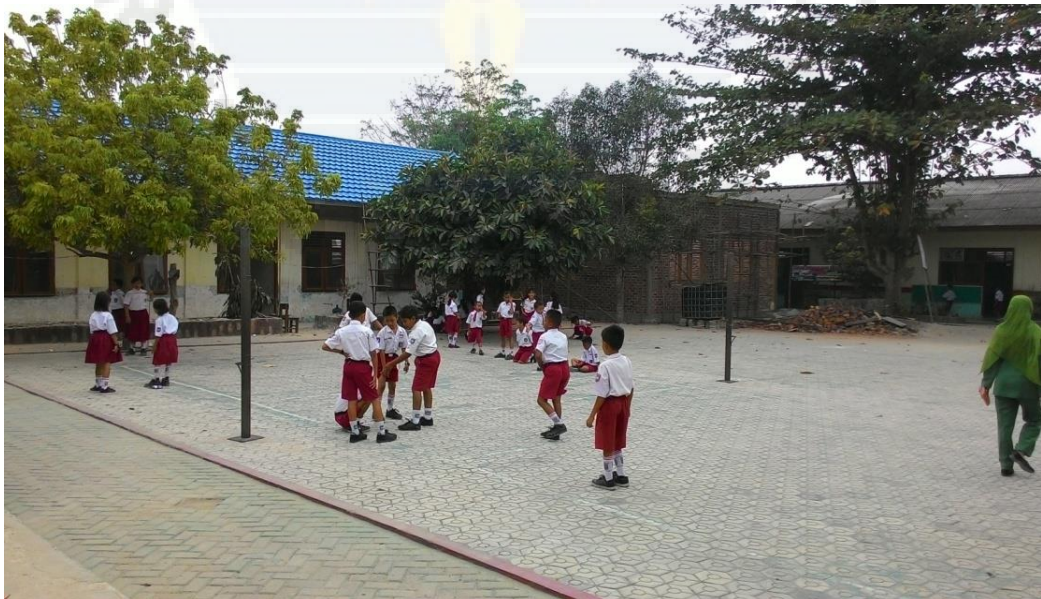
Gambar 2. Siswa SD N 28 Pangkalpinang