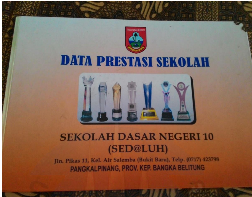
Gambar 5. Data prestasi SD N 10