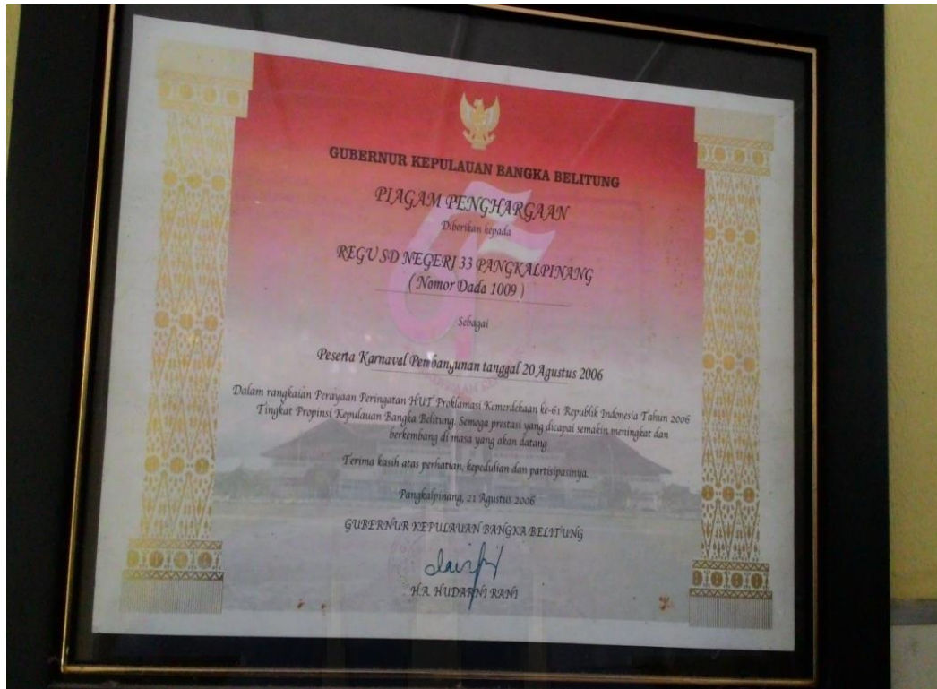
Gambar 3. Piagam penghargaan kepala sekolah SD N 33