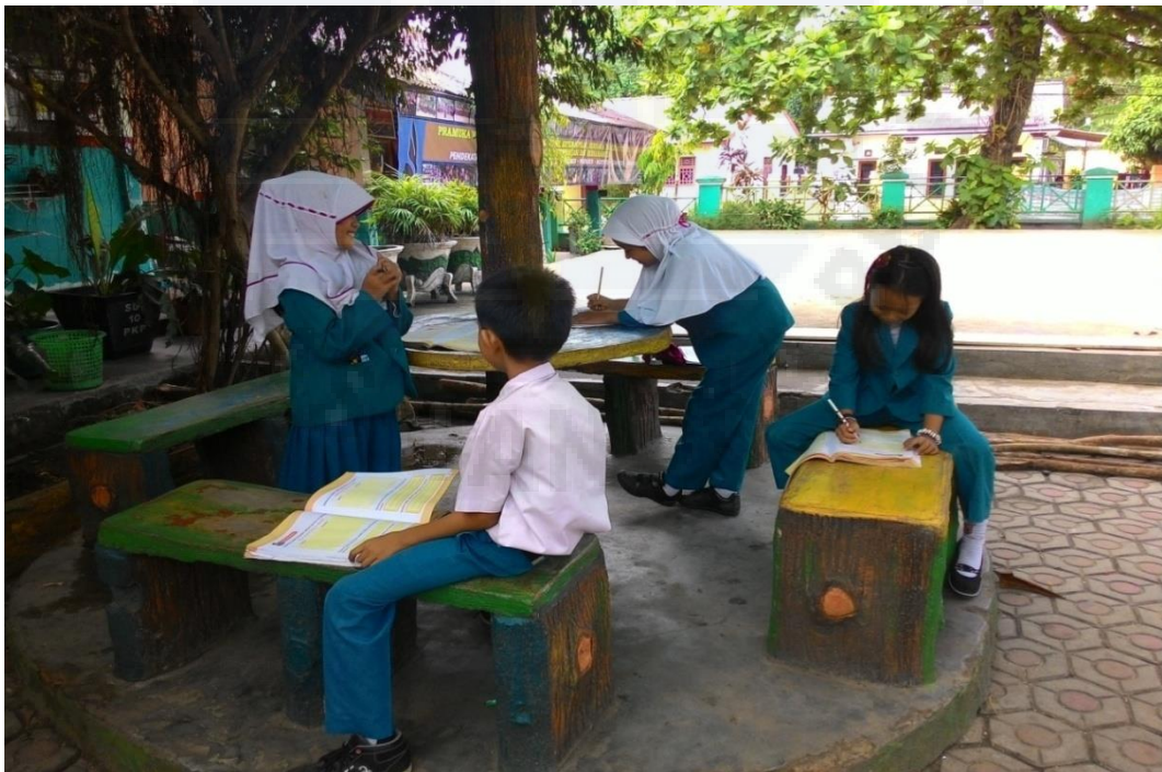
Gambar 6. Belajar Kelompok siswa SD N 10