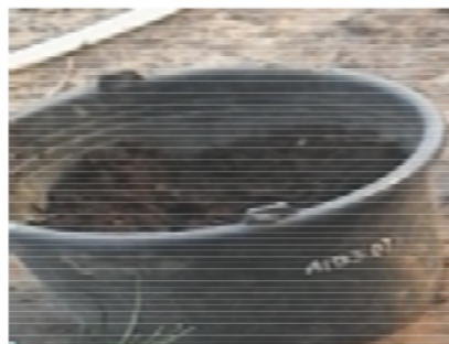
Gambar 8. Pupuk kotoran sapi sebagai salah satu bahan baku pembuatan POC

Adapun langkah-langkah pembuatan POC limbah kulit nenas yaitu pencacahan kulit nenas hingga berukuran kecil untuk mempermudah proses penguraian POC. Pencacahan dapat dilakukan secara manual maupun menggunakan mesin pencacah. Pencacahan kulit nenas secara manual dapat dilakukan menggunakan golok. Langkah selanjutnya ialah penambahan pupuk kandang dengan perbandingan 1:1 (Limbah kulit nenas: Pupuk kandang). Semua jenis pupuk kandang seperti pupuk kandang sapi, ayam dan kambing dapat dimanfaatkan sebagai bahan tambahan pembuatan POC limbah kulit nenas (Gambar 8.).