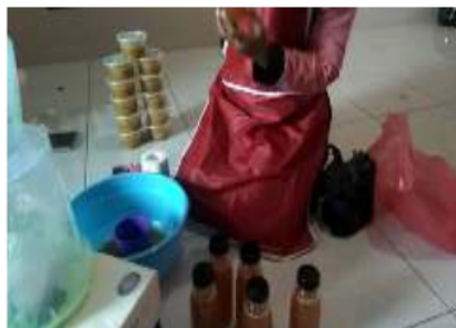
Gambar 7. Proses pengemasan selai dan sirup nenas

Tahapan terakhir yaitu proses pengemasan. Pengemasan selai dilakukan dengan menimbang selai terlebih dahulu kemudian selai dikemas menggunakan cup yang berukuran 250 g sedangkan sirup dikemas menggunakan botol sirup berukuran 350 ml (Gambar 7.). Total sirup dan selai yang dihasilkan dari 8 buah nenas yaitu sebanyak 6 botol sirup nenas berukuran 350 ml dan 11 cup selai nenas dengan netto 250 gram.