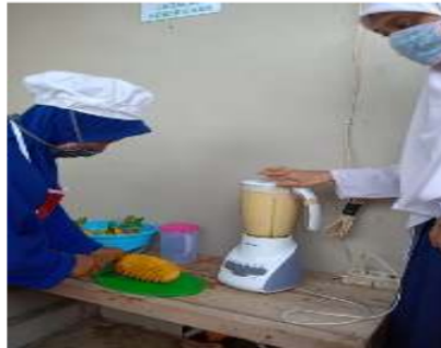
Gambar 5. Proses pemotongan dan pemblenderan buah nenas.

penambahan air untuk mengurangi kadar air dari buah nenas.