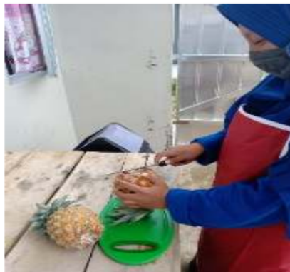
Gambar 3. Pengupasan kulit buah nenas

Proses selanjutnya yaitu pengupasan kulit nenas. Nenas dikupas menggunakan pisau tajam dan bersih. Pengupasan nenas diawali dengan pembuangan mahkota nenas dan daun kecil-kecil yang masih menempel pada buah nenas. Tangkai buah nenas pada saat pengupasan tidak dibuang terlebih dahulu untuk mempermudah proses pengupasan. Selanjutnya, kulit nenas dikupas tidak terlalu tebal agar daging buah nenas yang diperoleh lebih besar. Kulit nenas juga sebaiknya tidak dikupas terlalu tipis karena dikhawatirkan mata nenas pada daging buah tidak lepas. Kulit buah nenas dikupas dari pangkal buah nenas hingga ujung buah nenas untuk mempermudah dan mempercepat proses pengupasan buah nenas (Gambar 3.)