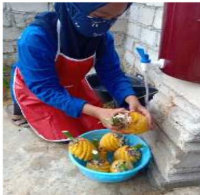
Gambar 4. Proses pencucian buah nenas yang telah dikupas kulitnya menggunakan air mengalir.

Nenas yang telah dikupas kemudian dimasukkan ke dalam baskom untuk wadah penyimpanan sementara. Selanjutnya, nenas yang telah dikupas kulitnya dibersihkan menggunakan air mengalir untuk menjaga kesterilan produk yang dihasilkan. Nenas cukup dicuci dengan menggosok daging buah nenas menggunakan tangan kemudian dibilas kembali menggunakan air bersih (Gambar 4.). Nenas yang telah dibersihkan kemudian di masukkan kembali untuk persiapan ke tahapan proses selanjutnya.