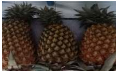
Gambar 2. Nenas yang telah memasuki kriteria bahan baku pembuatan selai dan sirup nenas.

Buah nenas dipilih untuk bahan baku pembuatan selai nenas harus memenuhi kriteria yang telah ditetapkan. Adapun kriteria pemilihan nenas yang tepat untuk dijadikan bahan baku pembuatan selai nenas dan sirup yaitu 2/3 bagian nenas telah berwarna kuning, 1/3 bagian nenas masih berwarna hijau untuk mempertahankan tingkat kematangan yang sesuai dengan permintaan konsumen, mata nenas sudah tumpul, nenas memiliki tekstur yang lembut bila ditekan, nenas telah memunculkan aroma dan berukuran maksimal. (Gambar 2.).