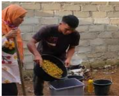
Gambar 9. Proses pencampuran bahan baku pembuatan POC limbah kulit nenas.

Langkah berikutnya setelah pencampuran bahan baku utama dan bahan tambahan lainnya untuk pembuatan POC limbah kulit nenas (Gambar 9.) Kemudian, dilakukan penambahan air secukupnya dan dilanjutkan dengan proses pengadukan. POC diaduk menggunakan kayu hingga bahan baku pembuatan POC tercampur merata.