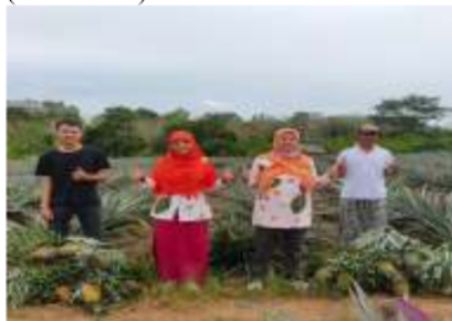
Gambar 1. Foto Bersama dengan pemilik kebun nenas Kelurahan Tua Tunu Indah

Tahapan pertama yang dilakukan dalam proses pembuatan selai dan sirup nenas ialah persiapan alat dan sarana produksi. Alat yang diperlukan yaitu pisau, blender, kuili panci, kompor gas, gas LPG , kain serbet, saringan, spatula dan baskom. Bahan yang diperlukan dalam pembuatan selai nenas ini hanya 2 bahan yaitu buah nenas dan gula pasir. Tahap selanjutnya yaitu pemilihan buah nenas agar didapatkan produk selai dan sirup nenas yang berkualitas. Buah nenas segar untuk dijadikan bahan baku pembuatan selai dan sirup nenas diperoleh dari kebun petani nenas yang terdapat di Kelurahan Tua Tunu (Gambar 1.).