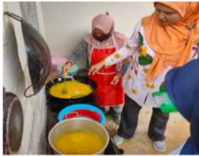
Gambar 6. Proses pemanasan selai dan sirup nenas

Tahapan terakhir yaitu proses pengemasan. Pengemasan selai dilakukan dengan menimbang selai terlebih dahulu kemudian selai dikemas menggunakan cup yang berukuran 250 g sedangkan sirup dikemas menggunakan botol sirup berukuran 350 ml (Gambar 7.). Total sirup dan selai yang dihasilkan dari 8 buah nenas yaitu sebanyak 6 botol sirup nenas berukuran 350 ml dan 11 cup selai nenas dengan netto 250 gram.