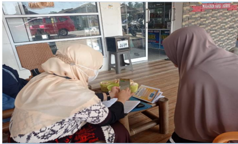
Gambar 2. Pelatihan dan Pendampingan Aplikasi Buku Kas