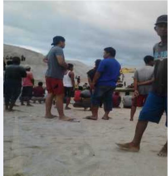
WAWANCARA DENGAN MASYRAKAT