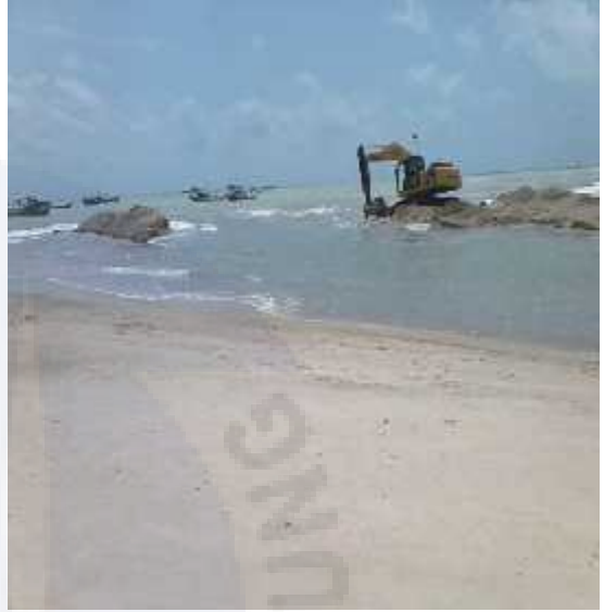
LOKASI ALUR MUARA AIR KANTUNG