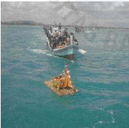
Tradisi Ruatan Laut Masyarakat Nelayan II