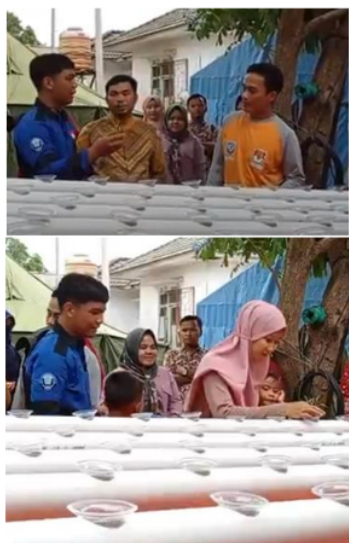
Gambar 4. Tim mahasiswa menjelaskan jenis-jenis substrat yang bisa digunakan sebagai media sayuran (kiri) dan memberikan kesempatan warga untuk mencoba menanam pada wadah hidroponik.

Setelah konstruksi demplot terselesaikan, dilakukan penyuluhan dan pelatihan dalam memanfaatkan dan mengelola demplot akuaponik. Penjelasan diberikan kepada warga terkait pengaturan sarana agar air kolam teralirkan terus menerus ke dalam pipa untuk mengirimkan nutrisi yang diperlukan sayuran. Substrat sayuran dapat menggunakan sabut kelapa yang banyak terdapat di sekitar lokasi pengabdian. Masyarakat diminta untuk mencoba menanam bibit sayuran ke dalam lubang-lubang pada pipa (Gambar 4). Roidah (2014) memaparkan sabut kelapa dapat digunakan sebagai substrat hidroponik selain gambut, sekam bakar dan rockwool (serabut bebatuan).