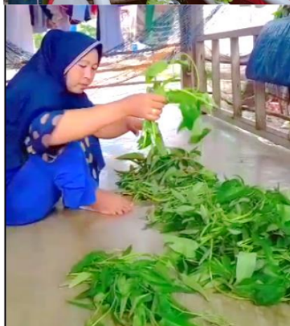
Gambar 8. Warga Pulau Panjang memanen sayuran Kangkung yang dihasilkan dari pengelolaan demplot akuaponik.

Setelah 1,5 bulan mengelola akuaponik, hasil monitoring keberlanjutan demplot secara daring dengan kepala dusun Pulau Panjang menunjukkan adanya panen Kangkung dalam jumlah yang lebih banyak. Hal ini menunjukkan bahwa produktifitas demplot berkelanjutan meskipun telah diserahkan sepenuhnya pengelolaan kepada masyarakat. Kondisi ini dapat dinilai sebagai keberhasilan program Bina Desa dalam memberikan pengetahuan tentang akuaponik dan memberdayakan masyarakat Pulau Panjang memproduksi sayuran secara mandiri. Keberhasilan demplot dalam produksi sayuran dalam sistem akuaponik yang dapat diamati secara langsung oleh masyarakat ini diharapkan meningkatkan pemahaman bagi masyarakat Pulau Panjang. Hal ini memungkinkan menjadi pemicu bagi masyarakat maupun kelompok masyarakat turut serta merintis budidaya sayuran melalui pengembangan akuaponik untuk ketersediaan nutrisi dan perekonomian keluarga.