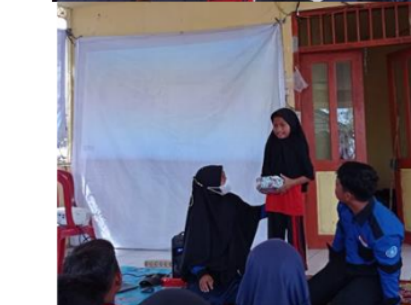
Gambar 6. Penyuluhan pencegahan pernikahan usia dini pada anak-anak