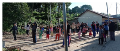
Gambar 7. Senam bersama masyarakat Pulau Panjang

Disela-sela kegiatan utama, mahasiswa yang tergabung dalam tim pengabdian melakukan kegiatan bersama masyarakat untuk membangun hubungan baik. Kegiatan tersebut berupa senam bersama (Gambar 7). Kegiatan yang sederhana ini memberikan manfaat besar tentang persepsi masyarakat kepada mahasiswa dari Universitas Bangka Belitung. Hubungan yang baik ini dapat menjadi kerjasama dan kegiatan berikutnya di pulau ini dapat berkelanjutan.