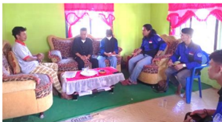
Gambar 1. Pertemuan Tim Mahasiswa Akuakultur dan Kepala Dusun Pulau Panjang untuk Membuat Kesepakatan Program Bina Desa