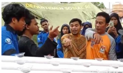
Gambar 5. Penjelasan tentang sistem kerja akuaponik dalam demplot

Nutrisi tersebut dimanfaatkan sayuran untuk pertumbuhannya.