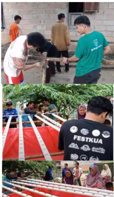
Gambar 3. Proses konstruksi demplot akuaponik yang dihadiri warga yang ingin tau tentang sistem produksi sayuran yang dipadukan dengan budidaya ikan.