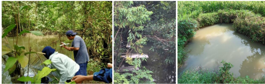
Gambar 2. Kondisi lokasi sampling ikan di hulu Sungai Lelabi, Riau Silip, Kabupaten Bangka (kiri) dan Membalong, Kabupaten Belitung (Tengah) dan Way Kanan (kanan)