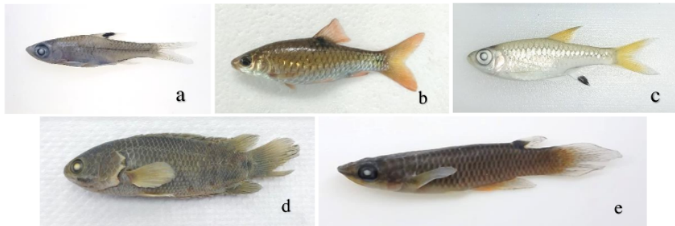
Gambar 3. Spesies ikan ekstremofil yang diuji dalam penelitian ini ( a. Brevibora sp, b. Barbodes binotatus , c. Rasbora bankanensis , d. Anabas testudineus , e. Aplocheilus panchax )