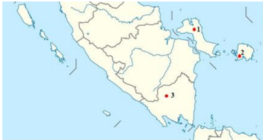
Gambar 1. Lokasi pengambilan sampel ikan. 1) Riau Silip, Bangka. 2) Membalong, Belitung, 3) Baradatu, Kabupaten Way Kanan, Lampung.

kekerabatannya, dan potensi variasi genetiknya akibat adaptasi lingkungan ekstrem. Ikan - ikan tersebut adalah Ikan Kenancat, Tanah, Bebidis, Kepala Timah, Seluang dan Bebidis yang secara morfologi memiliki kemiripan dengan karakter spesies berurutan Rasbora bankanensis , Barbodes binotatus , Aplocheilus panchax , Rasbora einthovenii , dan Brevibora cheeya . Barcoding DNA diterapkan menggunakan gen Sitokrom Oksidase I (COI) untuk memperoleh informasi genetik dari gen mitokondrianya. Penggunaan primer forward Fish-F2 dan reverse Fish-R2 (Ward et al. , 2005) dengan amplifikasi DNA pada suhu pre-denaturasi 95°C selama 1 menit, denaturasi pada 95°C selama 15 detik, annealing pada 52°C selama 15 detik, dan extension pada 72°C selama 10 detik (35 siklus), dan final extension pada 72°C selama 10 menit (Aisyah et al. , 2021) menunjukkan hasil uji kualitatif berbeda pada setiap spesies ikan. Kemunculan pita DNA teridentifikasi pada spesies Rasbora bankanensis , namun spesies lainnya tidak menunjukkan hasil adanya pita DNA. Produk hasil PCR yang tidak menunjukkan pita DNA saat diuji kualitatif menggunakan elektroforesis ini dimungkinkan memerlukan suhu anealing berbeda pada spesies yang berbeda. Untuk itu diperlukan optimasi suhu anealing pada proses PCR untuk mendapatkan pita DNA dan keberhasilan identifikasi DNA.