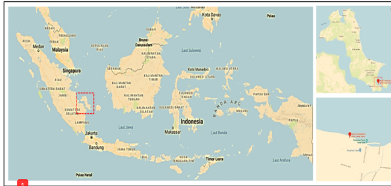
1 Gambar 1. Lokasi pengambilan sampel di Tukak Sadai, Bangka Selatan

1 Pengambilan sampel serasah daun dilakukan pada mangrove jenis Rhizophora apiculata di Tukak Sadai, Kabupaten Bangka Selatan pada koordinat -2^{\circ}58'30'' LS, 106^{\circ}38'56'' BT (Gambar 1). Pemilihan daun secara acak pada daun yang telah mengalami pelapukan. Sampel disimpan dalam kondisi dingin dan basah pada tempat steril. Penyimpanan dalam kondisi dingin dan basah dimaksudkan untuk menjaga bakteri tidak tumbuh maupun mengalami kematian akibat pengaruh suhu dan kelembapan.