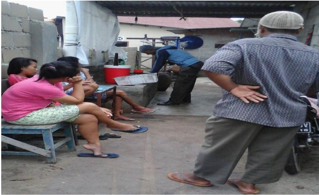
Gambar 3. Tampak etnis Tionghoa dan Melayu saling berinteraksi di sela – sela aktivitas