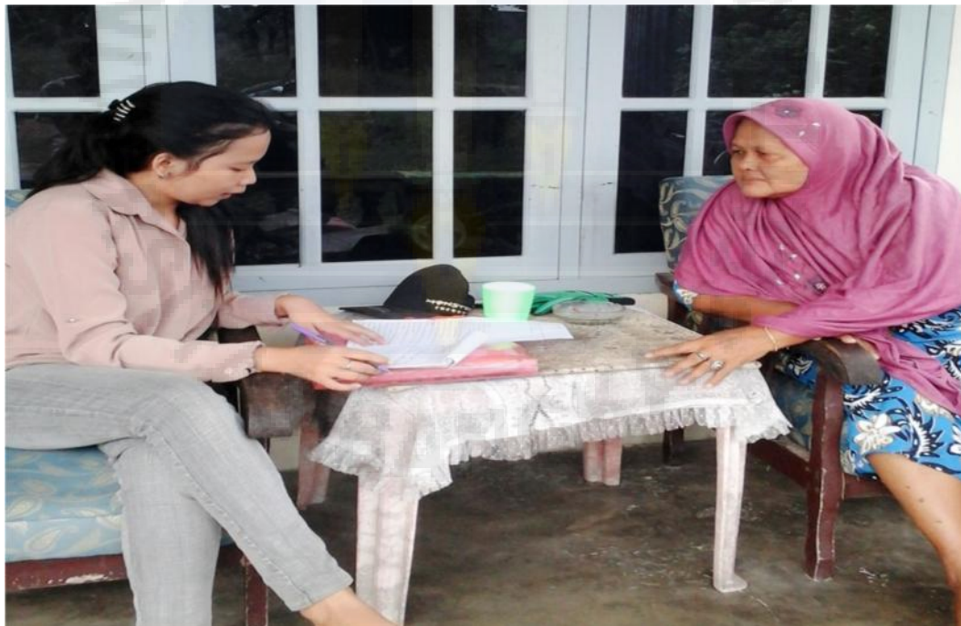
Gambar 4. Wawancara dengan warga etnis Melayu