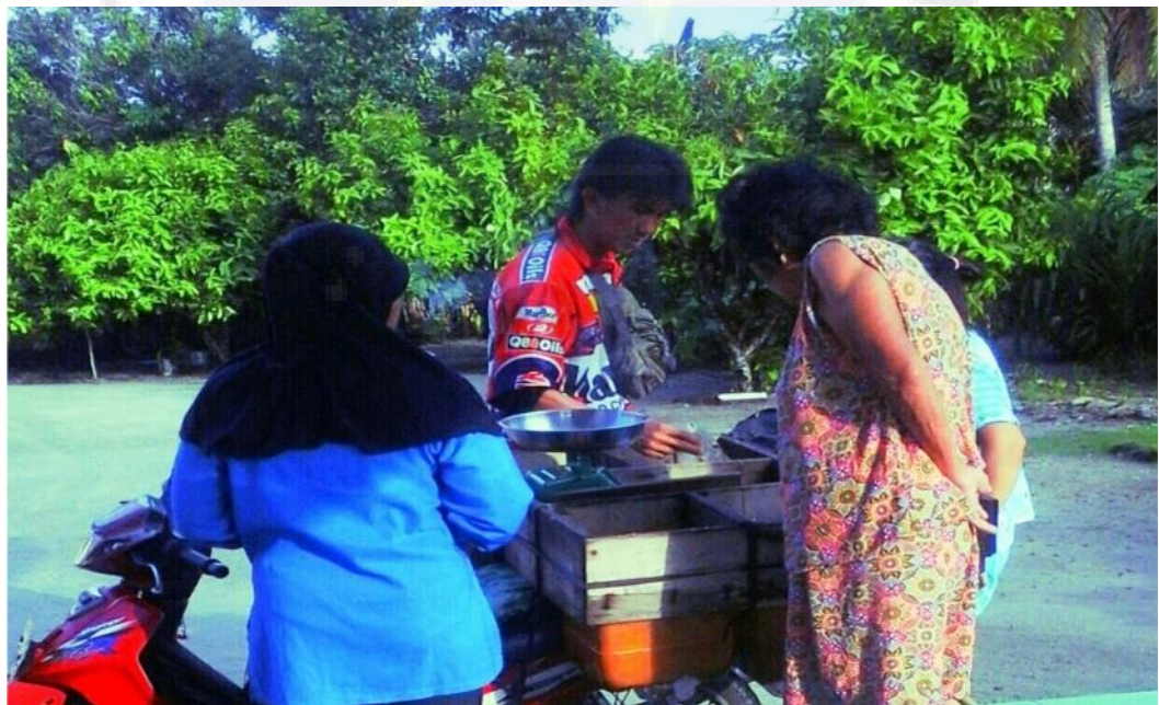
Gambar 2. Bertemunya etnis Tionghoa dan Melayu saat membeli dagangan keliling (halal).