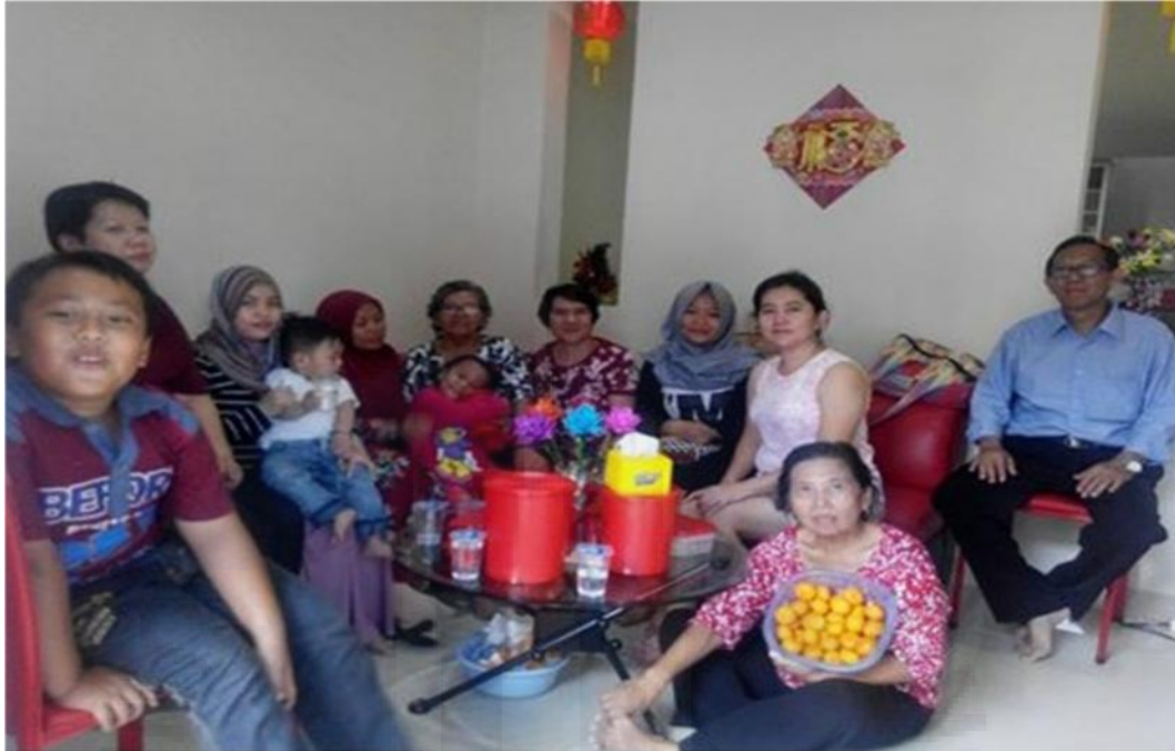
Gambar 1. Kebersamaan masyarakat Tionghoa dan Melayu pada perayaan Imlek di Kelurahan Kuday.