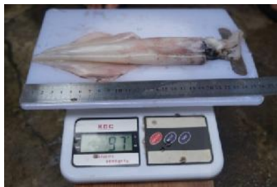
Pengukuran Panjang Berat Cumi-cumi Jantan