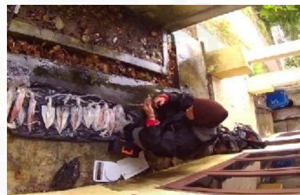
Pembelahan Mantel Cumi-cumi