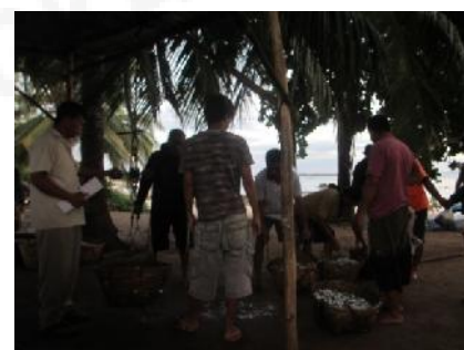
Aktivitas Nelayan Bedukang