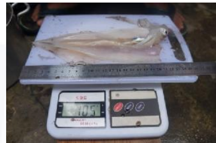
Contoh Mantel Cumi-cumi Jantan Yang Telah Dibuka