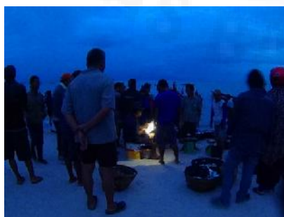
Aktivitas Nelayan Rebo