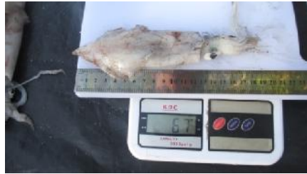
Pengukuran Panjang Berat Cumi-cumi Betina