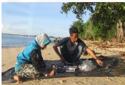
Penimbangan dan Pengukuran Cumi-cumi