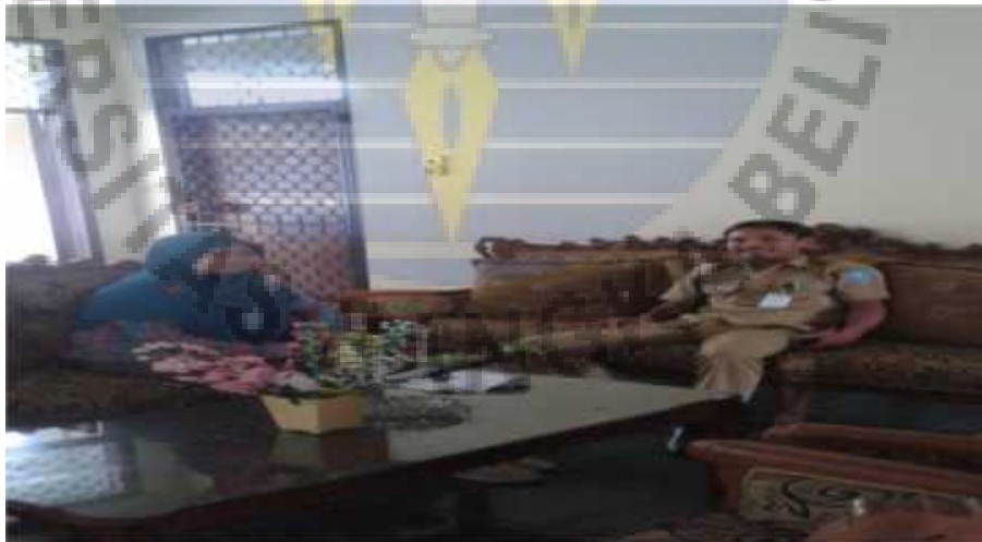
Gambar 4 Peneliti dengan pegawai BKPSDM Kabupaten Bangka