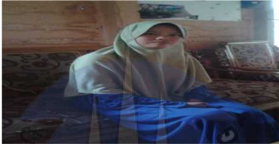
Gambar 1 Penyandang tuna daksa yang mengalami cacat kaki dan tangan