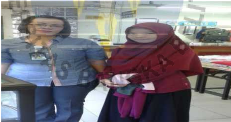
Gambar 6 Peneliti dengan Manajer Puncak Sungailiat