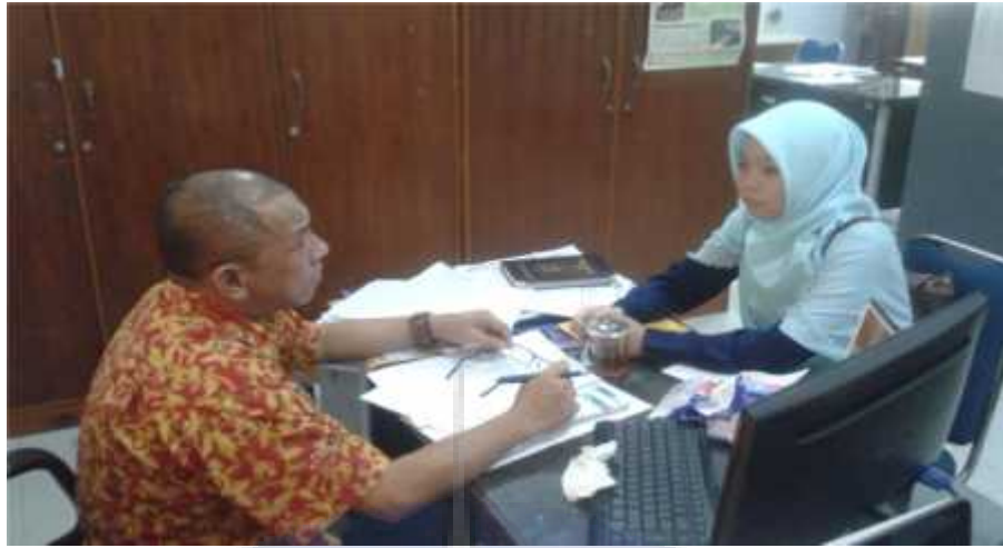
Gambar 3 Wawancara peneliti dengan pegawai BAPPEDA Kabupaten Bangka