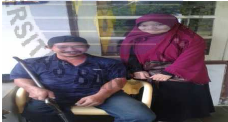
Gambar 2 Peneliti dengan penyandang tuna daksa yang mengalami kelainan kaki