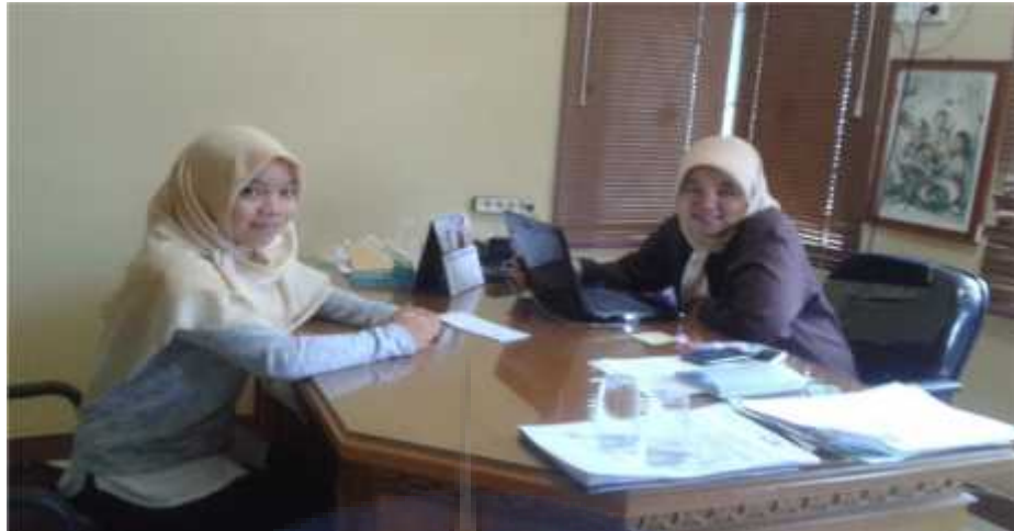
Gambar 5 Wawancara dengan Kepala Humas RS Medika Stania Sungailiat