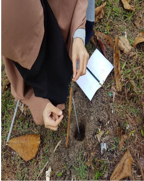
Pengukuran suhu tanah