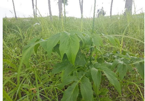
Pantai Nek Aji Kab Bangka Selatan