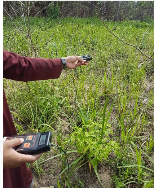
Pengukuran intensitas cahaya