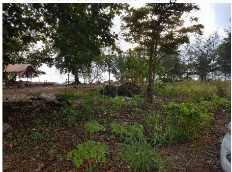
Pantai Rebo Kab Bangka