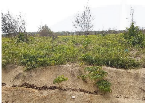
Pantai Temberan Kab Bangka