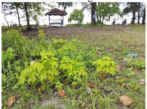
Pantai Penganak Kab Bangka Barat