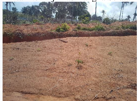
Pantai Rambak Kab Bangka