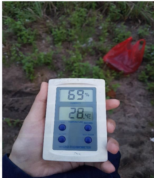
Pengukuran suhu udara dan kelembaban udara