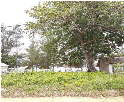
Pantai Pukan Kab Bangka