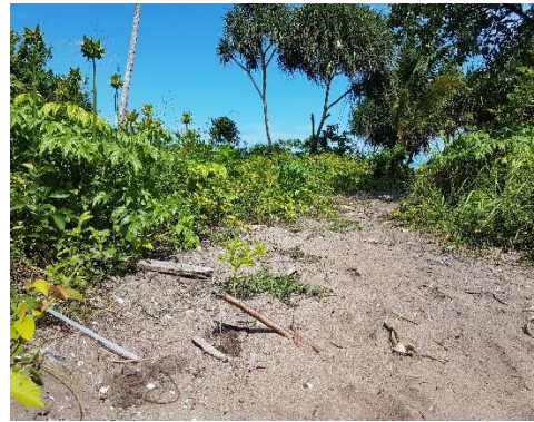
Pantai Penyak Kab Bangka Tengah