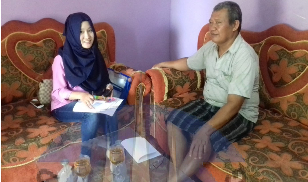
Gambar 8. Wawancara dengan masyarakat yang memandang dengan citra negatif.