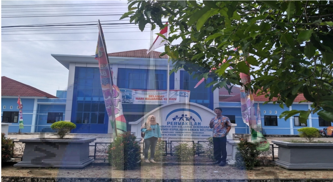
Gambar 2. Wawancara dengan KABID Pengendalian Penduduk dan Keluarga Berencana Kota Pangkalpinang.