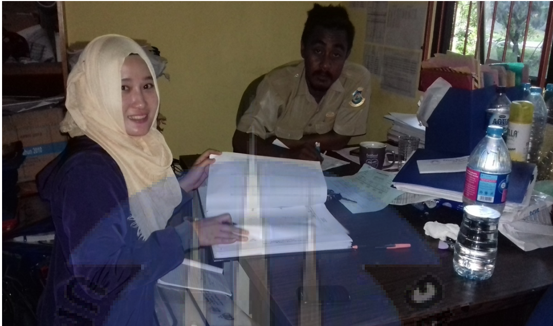
Gambar 4. Data Akseptor laki-laki yang menggunakan KB