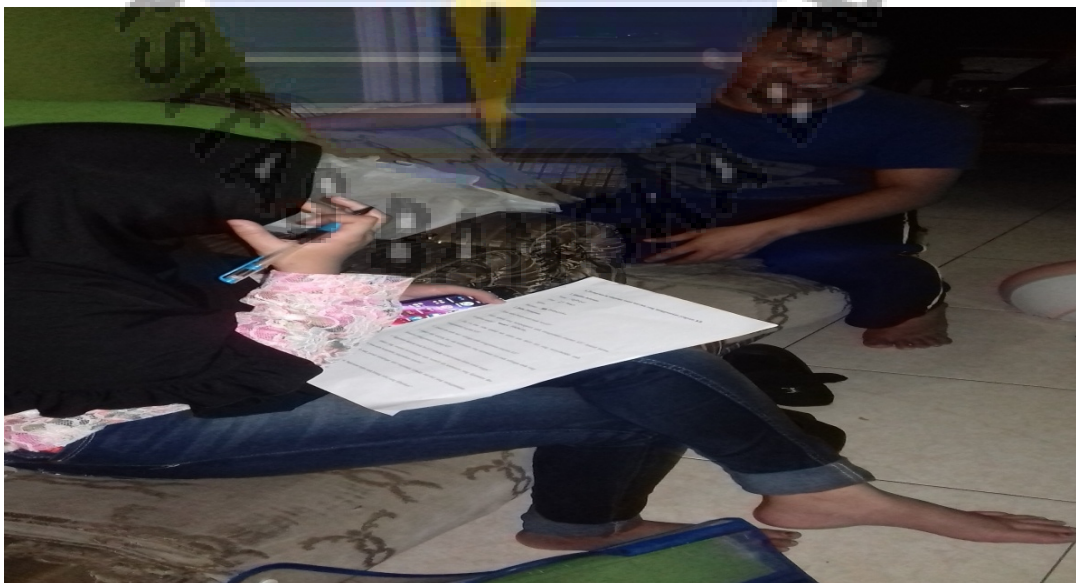
Gambar 6. Wawancara yang dilakukan pada akseptor laki-laki (kondom)