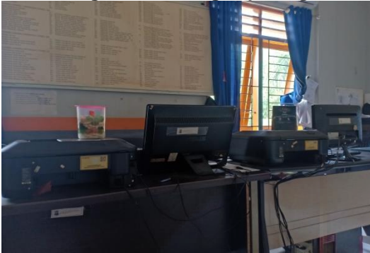
Gambar I.2 Kondisi di dalam ruangan bagian Lalu Lintas Angkutan Jalan Dinas Perhubungan Kota Pangkalpinang