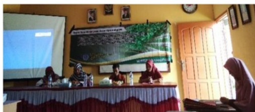
Gambar 2 Kegiatan penyuluhan tentang hidroponik.

Kegiatan pelatihan hidroponik tidak sepenuhnya diikuti oleh seluruh anggota PKK Pagarawan yang diundang dalam kegiatan tersebut. Hal itu terjadi karena adanya beberapa