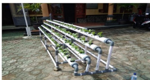
Gambar 5 Penanaman pada media hidroponik.