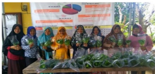
Gambar 6 Pemanenan tanaman hidroponik.