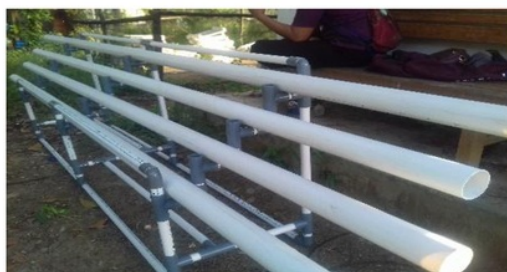
Gambar 4 Media penanaman hidroponik.