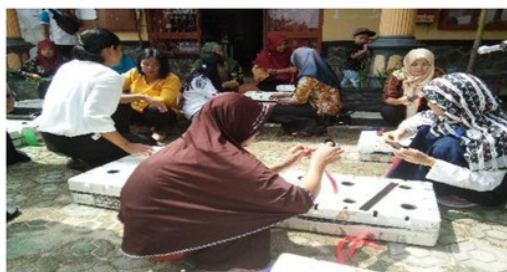
Gambar 3 Kegiatan pelatihan pembuatan media hidroponik.