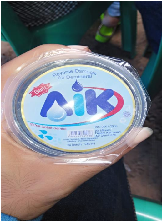
Contoh : Air Minum Merek AIK