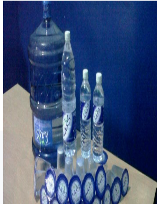
Contoh : Air Minum Merek HASS