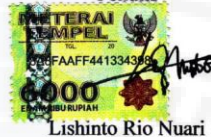
Lishinto Rio Nuari