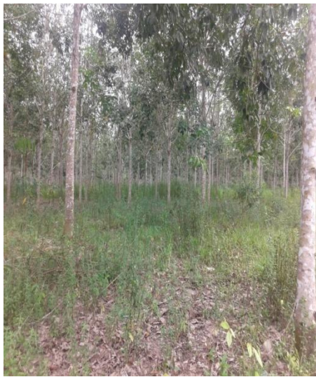
Lahan Banyak Serasah

Keterangan : Setiap satu kebun diambil 5 titik, tiap satu titik 2 kali ulangan pengambilan sampel