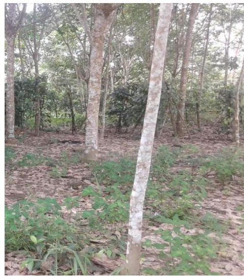
Lahan Sedikit Serasah