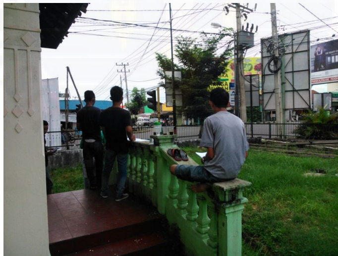
b) Pengambilan sampel Data Arus Lalu lintas