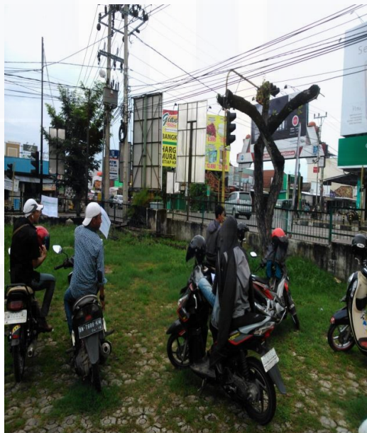
b) Pengambilan sampel Data Arus Lalu lintas