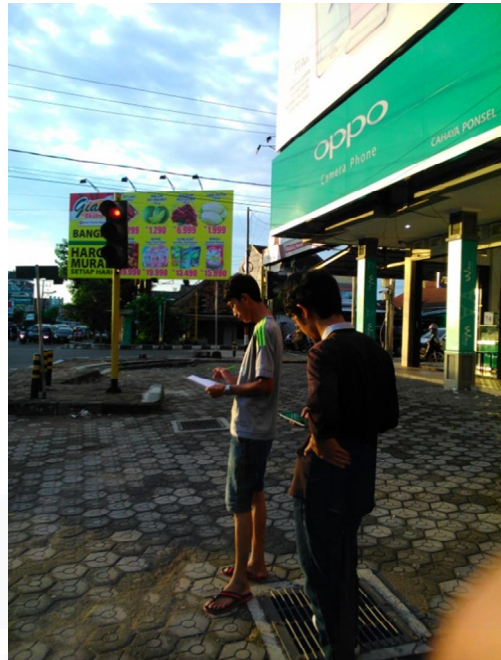
a) Pengambilan sampel Waktu Siklus